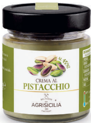
Crema al Pistacchio Pistaziencreme