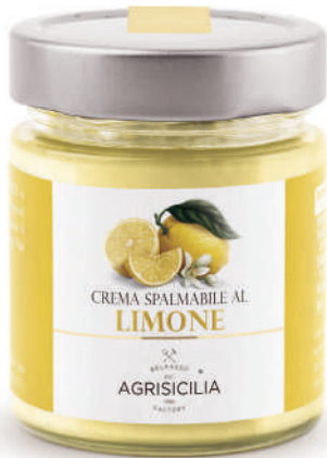
Crema al Limone Zitronencrem