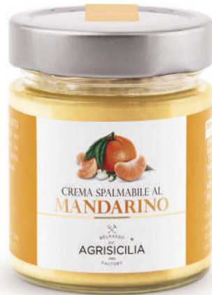
Crema al Mandarino Mandarinencreme