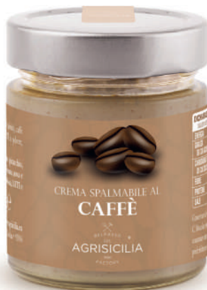
Crema al Caffè Kaffeessahne