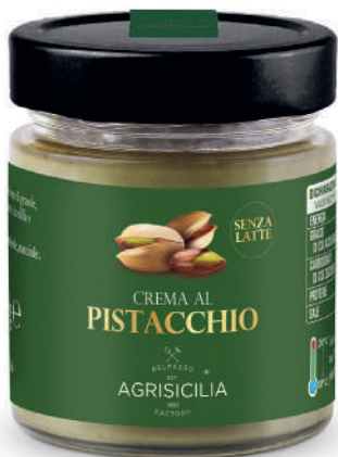
Crema al Pistacchio senza latte Milchfreie Pistaziencreme