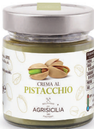
Crema al Pistacchio Pistaziencreme