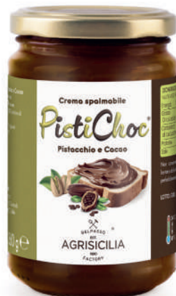
Crema spalmabile al Pistacchio e Cacao Haselnuss-Streichcreme aus Sizilien