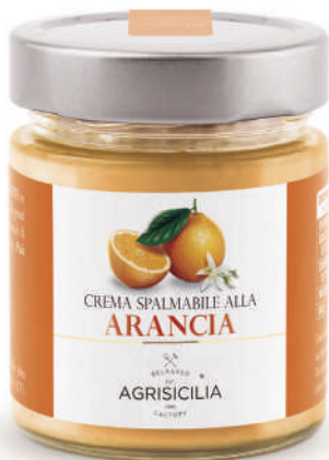
Crema alla Arancia Orangencreme