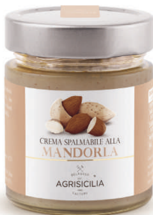
Crema spalmabile alle Mandorla Streichfähige Mandelcreme