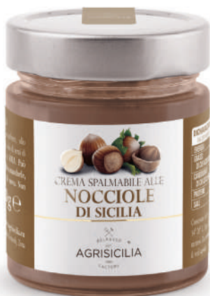
Crema spalmabile alle Nocchie di Sicilia Haselnuss-Streichcreme aus Sizilien